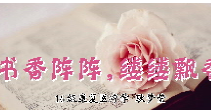
16 级康复治疗学 张书芳

不知何时踏过这一带梅花,谁的首声悠悠,吹散了半池寒烟。一人一马,一卷一酒一天涯。