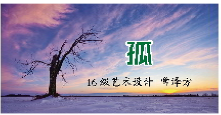
16 级艺术设计 曹泽方