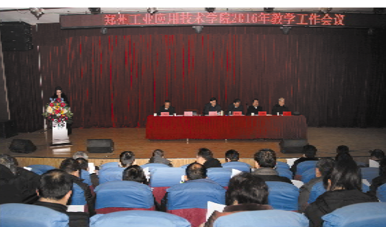
我校召开 2016 年教学工作会议

12月29日,我校在东区校区演播厅举行了2016年教学工作会议。校党委书记杨光枝、张清华、徐春华出席,各二级学院、二级教学单位负责人、系部主任、教研室主任、专业负责人等参加了会议。